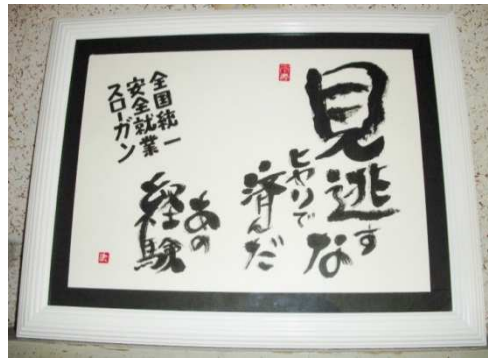
会員さんからの寄贈品