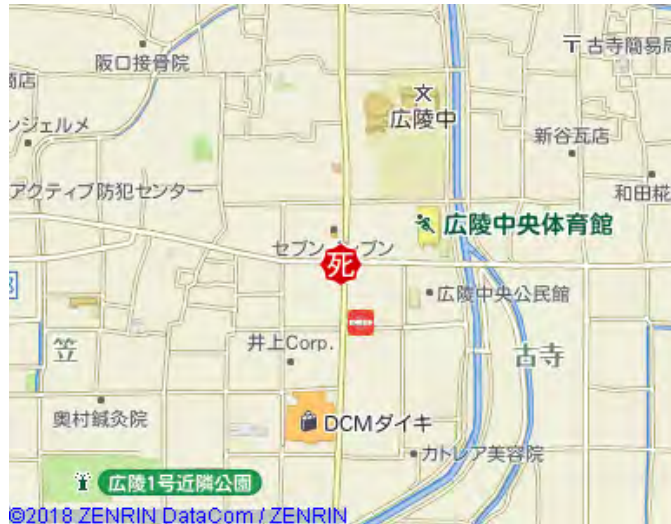
死亡事故現場：広陵町笠付近

9月6日午後5時ごろシルバー人 材センターの会員が就業帰途に県道 で左折してきた大型トラックにはね られ死亡しました。